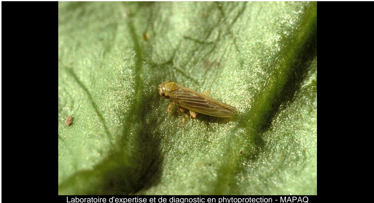
Laboratoire d'expertise et de diagnostic en phytoprotection - MAPAQ

Cicadelle de l'aster - Aster leafhopper/ Macrostelus quadrilineatus Forbes Ordre/Famille : Hemiptera/Cicadellidae