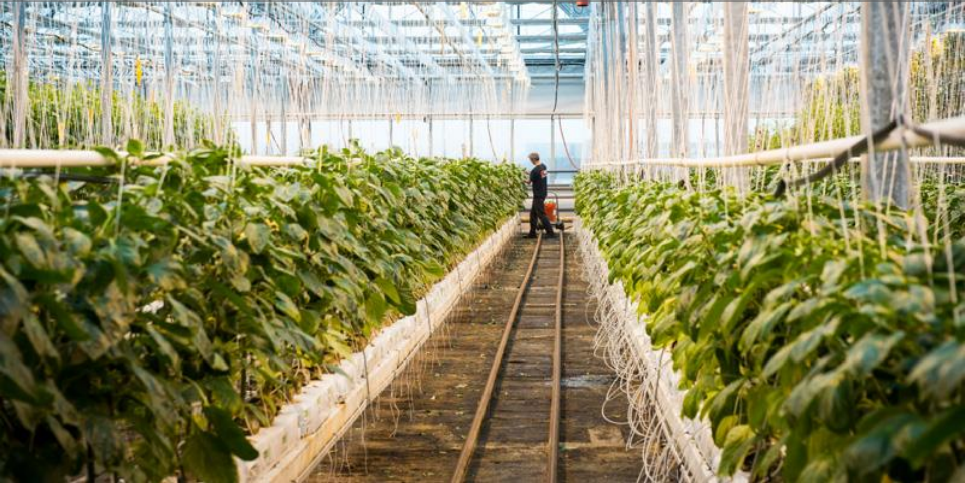
Serres commerciales sur toit – Fermes Lufa