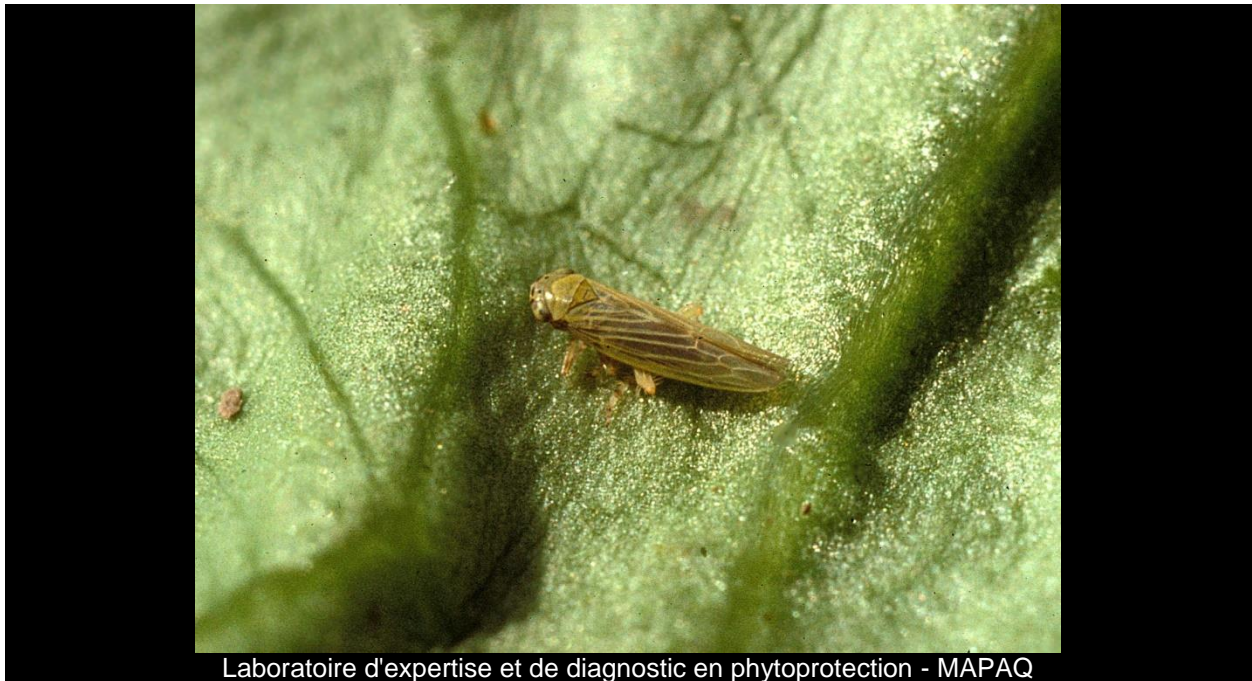
Laboratoire d'expertise et de diagnostic en phytoprotection - MAPAQ

Cicadelle de l'aster - Aster leafhopper/ Macrostelus quadrilineatus Forbes Ordre/Famille : Hemiptera/Cicadellidae